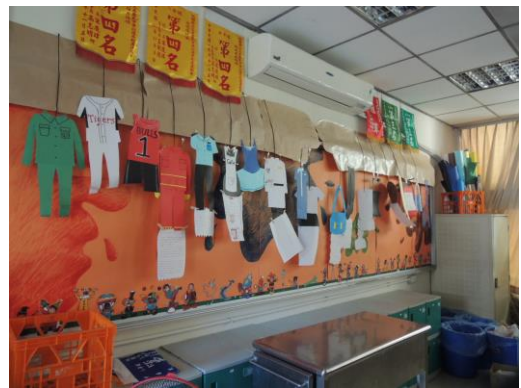
(14)活動七-教室布置融入生涯教育： 以各種職業、職群為創作主題，透過 導師與學生共同討論，將生涯教育融 入生活。