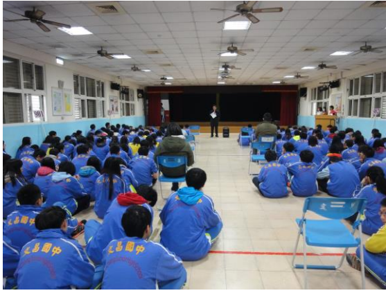
(11)活動六-生涯教育與職群介紹活動