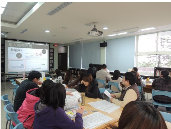
(15) 活動八：生涯教育與模擬志願選填 說明