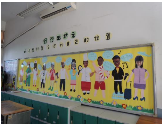
(13)活動七-教室布置融入生涯教育： 以各種職業、職群為創作主題，透過 導師與學生共同討論，將生涯教育融 入生活。