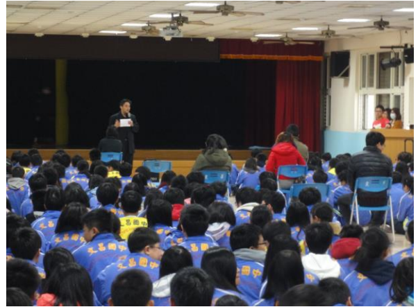
(12) 活動六-生涯教育與職群介紹活動