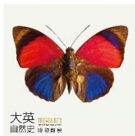
克勞蒂亞 亞美蝶(誤)