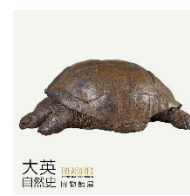
規規矩矩 亞達伯拉象龜