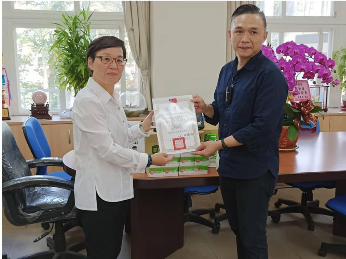
走出文昌—社區服務(母親節特輯)